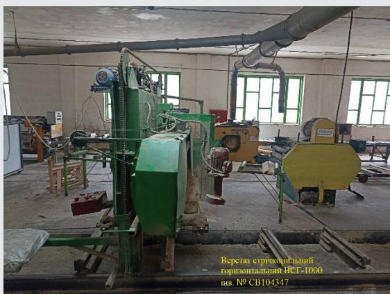
Верстат стрічковий горизонтальний ВСТ-1000 інв. № СВ104347