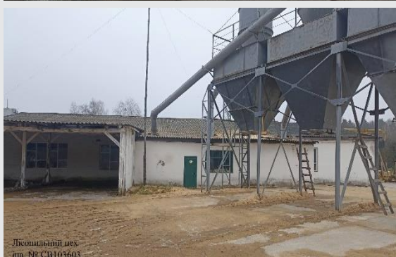
Лісопильний цех інв. № СВ103603