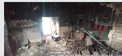
Частина сараю №1-1 Дуже приміщення, три кімнати в загальній площі 3,7кв.м., 1,7кв.м та 15,4кв.м