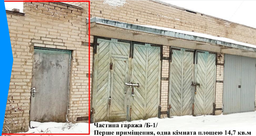
Частина гаража /Б-1/ Перше приміщення, одна кімната площею 14,7 кв.м

45701, Волинська обл., Луцький р-н, м. Горохів, вул. Гетьманська, 5