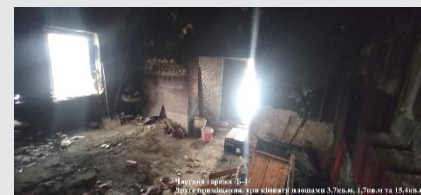
Частина сараю №1-1 Дуже приміщення, три кімнати в загальній площі 3,7кв.м., 1,7кв.м та 15,4кв.м