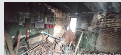
Частина сараю №1-1 Дуже приміщення, три кімнати в загальній площі 3,7кв.м., 1,7кв.м та 15,4кв.м