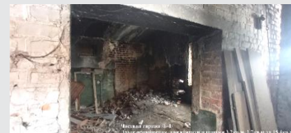
Частина сараю №1-1 Дуже приміщення, три кімнати в загальній площі 3,7кв.м., 1,7кв.м та 15,4кв.м