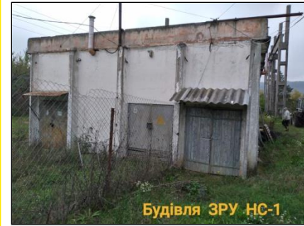
Будівля ЗРУ НС-1