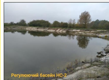
Регулюючий басейн НС-2